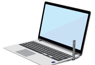
컴퓨터를 활용해 충전가능 (이럴 경우 마치 USB를 사용하는 것처럼 보일 수 있음)