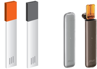
(왼쪽부터) 국내 출시를 앞두고 있는 졸 유사 담배제품인 KT&G의 릴 베이퍼, 일본 조즈