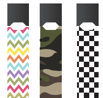
줄을 취향에 맞게 꾸밀 수 있는 스티커