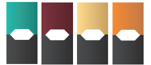
팟(액상카트리지) 맛에 따라 색상이 다름